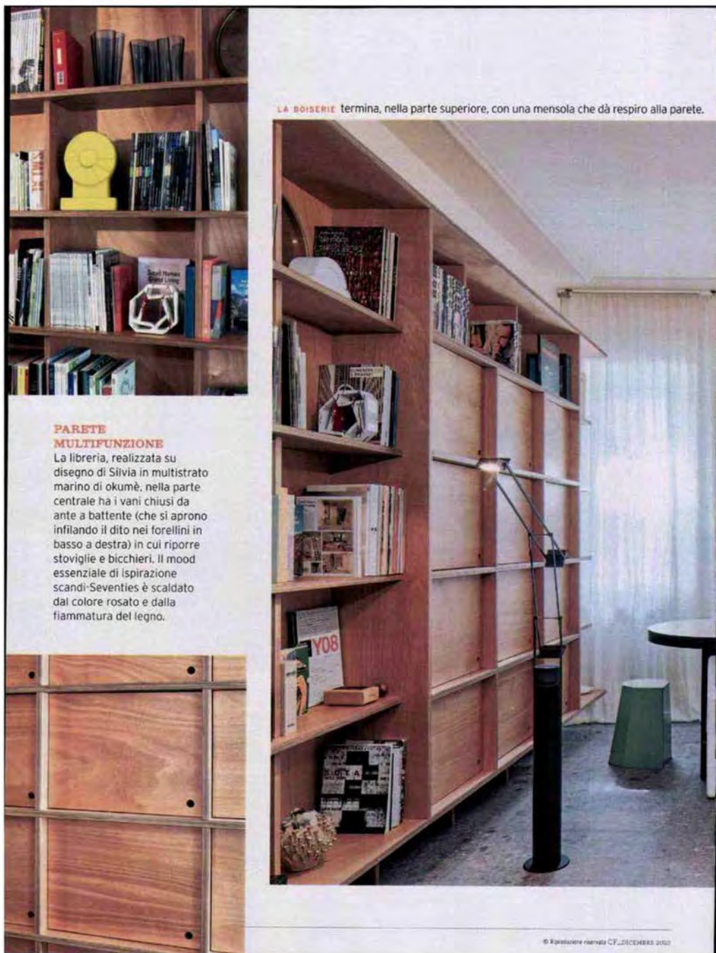
LA BOISERIE termina, nella parte superiore, con una mensola che dà respiro alla parete.